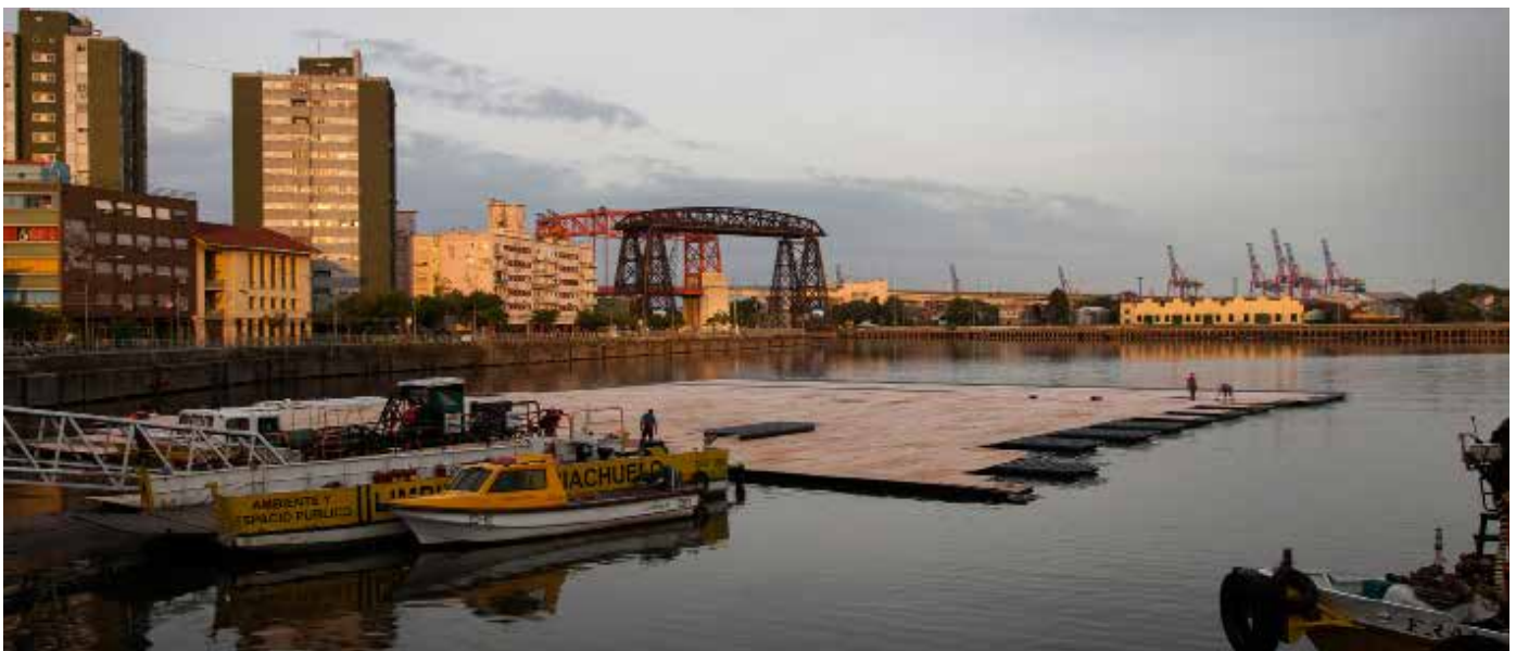
Backstage La vida es una Milonga : Tango de Fuegos Artificiales para Argentina.