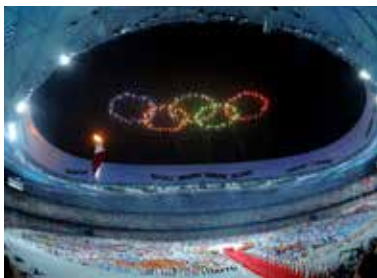
Proyecto de fuegos artificiales para la Apertura Ceremonia de los Juegos Olímpicos de Beijing, 2008.

- The Earth Has Its Black Hole Too: Project for Extraterrestrials No. 16, Hiroshima Central Park cerca de A-Bomb Dome, Hiroshima, realizado el 1 de octubre, encargado por Hiroshima City Museum of Contemporary Art para la exhibición Creativity in Asian Art Now.