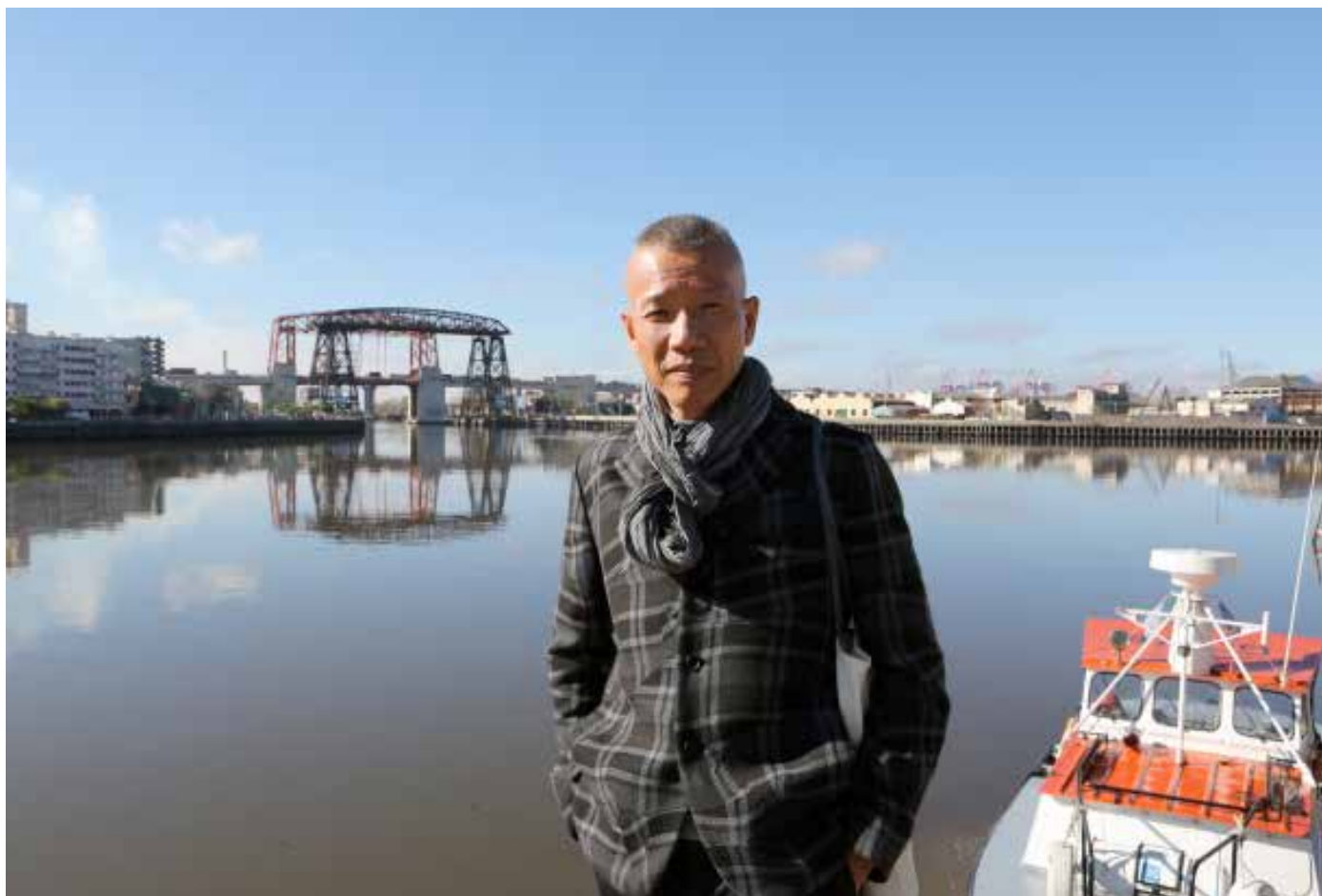
Cai Guo-Qiang en la Vuelta de Rocha, Buenos Aires, 2014.

SABADO 24 DE ENERO 20 HS Vuelta de Rocha / La Boca