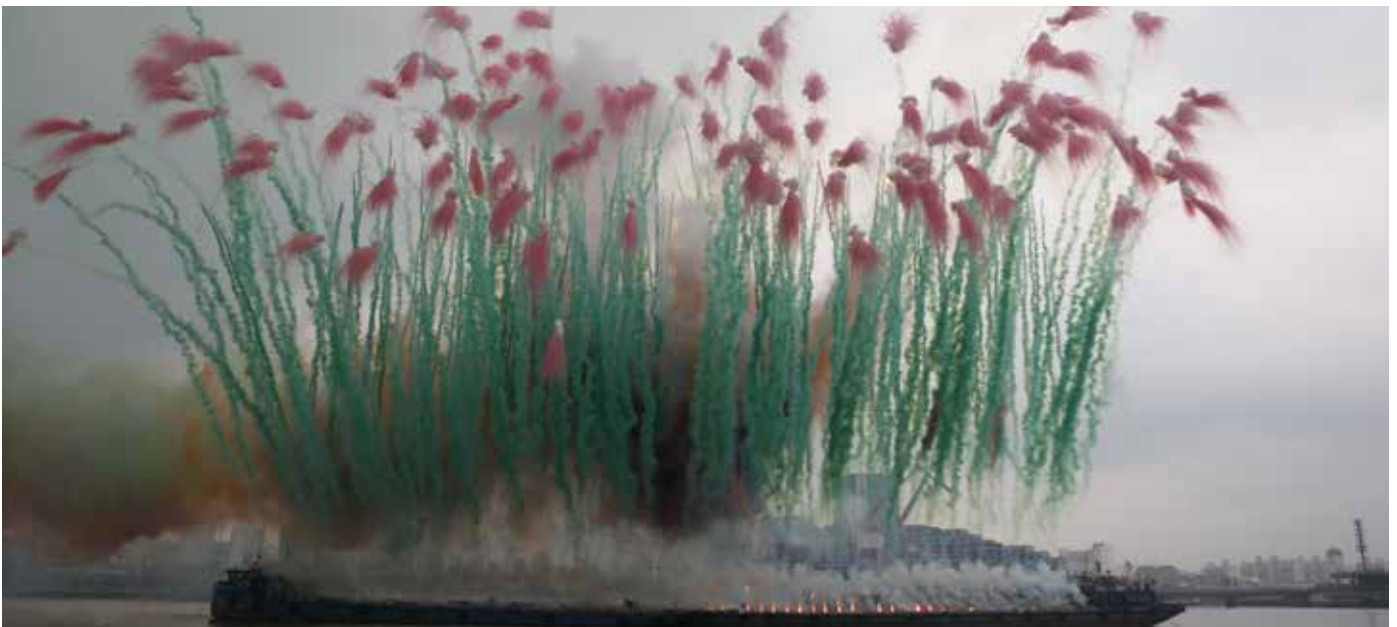
Remembrance, el capítulo dos de Elegía: Evento Explosión para la Apertura de Cai Guo-Qiang: The Ninth Wave , realizada en la orilla del río de la Power Station of Art, el 8 de agosto de 2014, 5:00 pm, 8 minutos de duración aproximada.

- Elegy: Explosion Event for the Opening de Cai Guo-Qiang: The Ninth Wave , Power Station of Art, Shanghai, realizado el 8 de agosto, encargado por Power Station of Art.