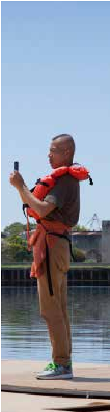
Backstage La vida es una Milonga: Tango de Fuegos Artificiales para Argentina.

negocios familiares de fabricación de petardos pertenecientes a conocidos de su familia. Al principio desconoce la composición química de la pólvora o cómo controlar los estallidos, pero persiste en sus experimentos y crea violentas explosiones. Los resultados son frecuentemente desastrosos.