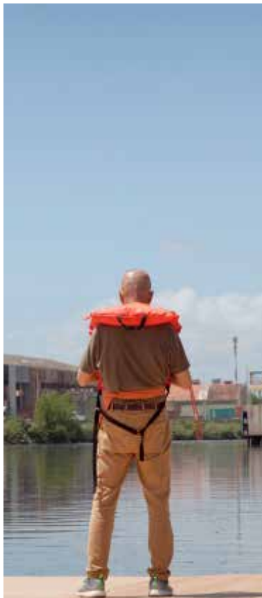
Backstage La vida es una Milonga: Tango de Fuegos Artificiales para Argentina.

“Los proyectos de fuegos son efímeros y desaparecen en un instante. Los espectadores presentes usan sus cuerpos y mentes para registrar la energía y comprender los elementos del trabajo que los conmueven. Hay eventos diurnos –que tienen lugar bajo el sol y se hacen con humo–, nocturnos –que se hacen con luz–, y en la penumbra entre noche y día, que establecen una nueva relación tiempo-espacio.”