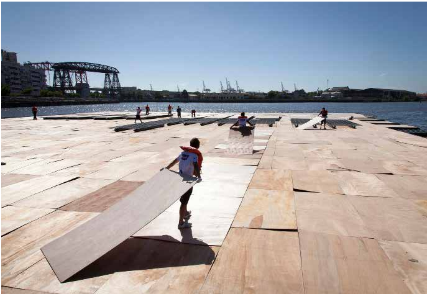
Backstage La vida es una Milonga: Tango de Fuegos Artificiales para Argentina.

Con respecto a la coordinación pirotécnica del evento, bajo el concepto y diseño artístico de Cai Guo-Qiang, Liu Lin coordinó y lideró el equipo de 13 técnicos chinos que llegaron al país.