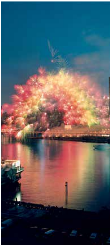
Transient Rainbow, realizado sobre East River, New York, 29 de junio de 2002.

- Blue Dragon , Hyogo Harbor, Kobe, realizado el 13 de julio, encargado por Hyogo Prefectural Museum of Art, Kobe for The Power of Art: The 2nd Inaugural Show of the Prefectural Museum of Art . Primer intento, sin éxito, en Brisbane en 1999, encargado por Queensland Art Gallery para The Future: The Third Asia-Pacific Triennial of Contemporary Art .