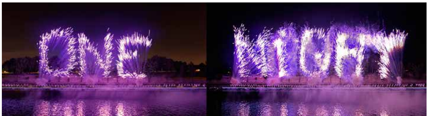
Un encuentro de amor francés en One Night Stand de Cai Guo-Qiang: evento de explosión para Nuit Blanche, realizado sobre el Río Sena, entre el Louvre y el Musée d'Orsay, Paris, Francia, 5 de Octubre, 2013.

- Wind Shadow , Barbican Theatre, London, 6-10 de octubre, en colaboración con Cloud Gate Dance Theatre of Taiwan.