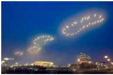
Footprints of History: Proyecto para la ceremonia de apertura de los Juegos Olímpicos de Beijing, 2008.