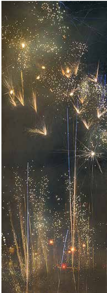
Un encuentro de amor francés, parte de Aventura de una noche: Proyecto de explosión para Nuit Blanche. Realizado en el río Sena, entre el Musée du Louvre y Musée d'Orsay, Paris, Francia, 5 de octubre, 2013.

- Tornado: Explosion Project for the Festival of China , Potomac River, Washington, D.C., realizado el 1 de octubre, encargado por John F. Kennedy Center para Performing Arts for The Kennedy Center Festival of China .