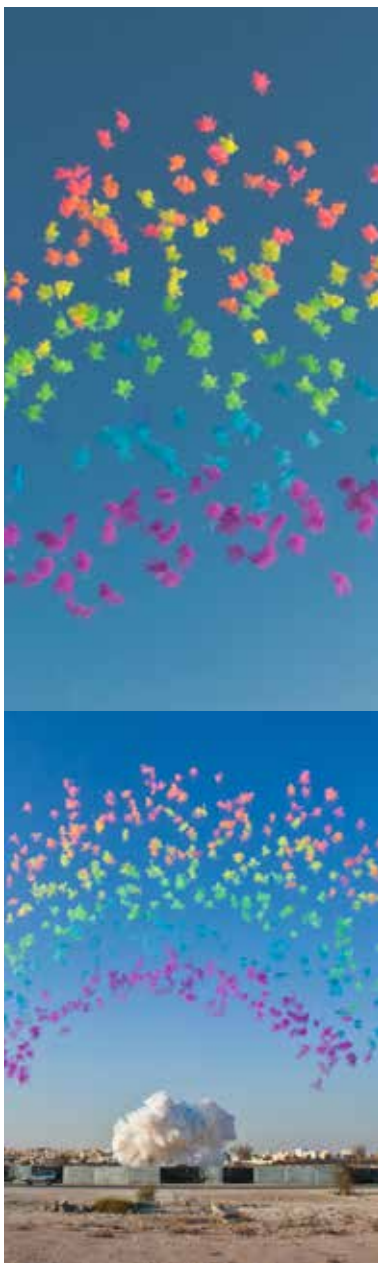
Black Ceremony, encargo del Mathaf: Arab Museum of Modern Art, Doha, Qatar, 5 de diciembre 2011.

La pólvora, mezcla de nitrato potásico, carbón y azufre, es el invento más celebre de China, cuyo significado literal en chino es “medicina de fuego”. Fue originalmente un invento de los alquimistas taoístas que buscaban un “elixir de la inmortalidad” imperial, y los fuegos artificiales, una invención relacionada con la pólvora, se han utilizado desde siempre para celebraciones y para ahuyentar a los malos espíritus. Cai mina la identificación de la pólvora con China, al tiempo que alude a su uso medicinal original y a su actual connotación violenta. (...) Tanto el proceso químico de la explosión como la creación, destrucción y desaparición de la obra en sí están concebidas para producir una catarsis, tanto física como conceptual.