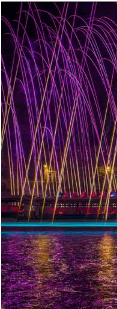
Un encuentro de amor francés en One Night Stand de Cai Guo-Qiang: evento de explosión para Nuit Blanche, realizado sobre el Río Sena, entre el Louvre y el Musée d'Orsay, París, Francia, 5 de Octubre, 2013.

- Skybound UFO y Shrine , Obihiro Racetrack, Obihiro, Hokkaido, realizado el 11 de agosto, encargado por P3 art and environment para Tokachi International Contemporary Art Exhibition: Demeter.